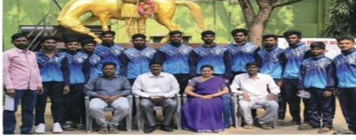
విజయవాడ, డిసెంబర్ 31 (భారత్ న్యూస్)